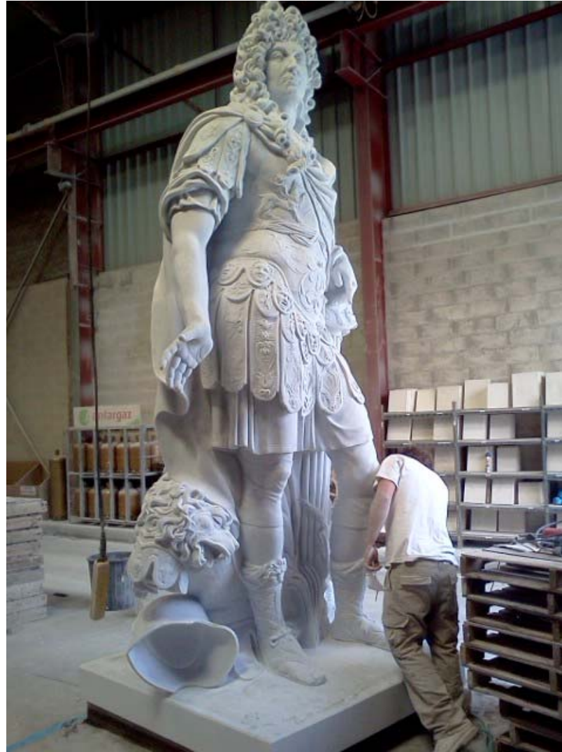
Sculpture de Louis XIV, marbre. Paris, 2012.