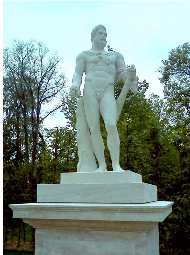
Reproduction de statues du Louvres et Versailles, marbre. Paris 2011-2012.