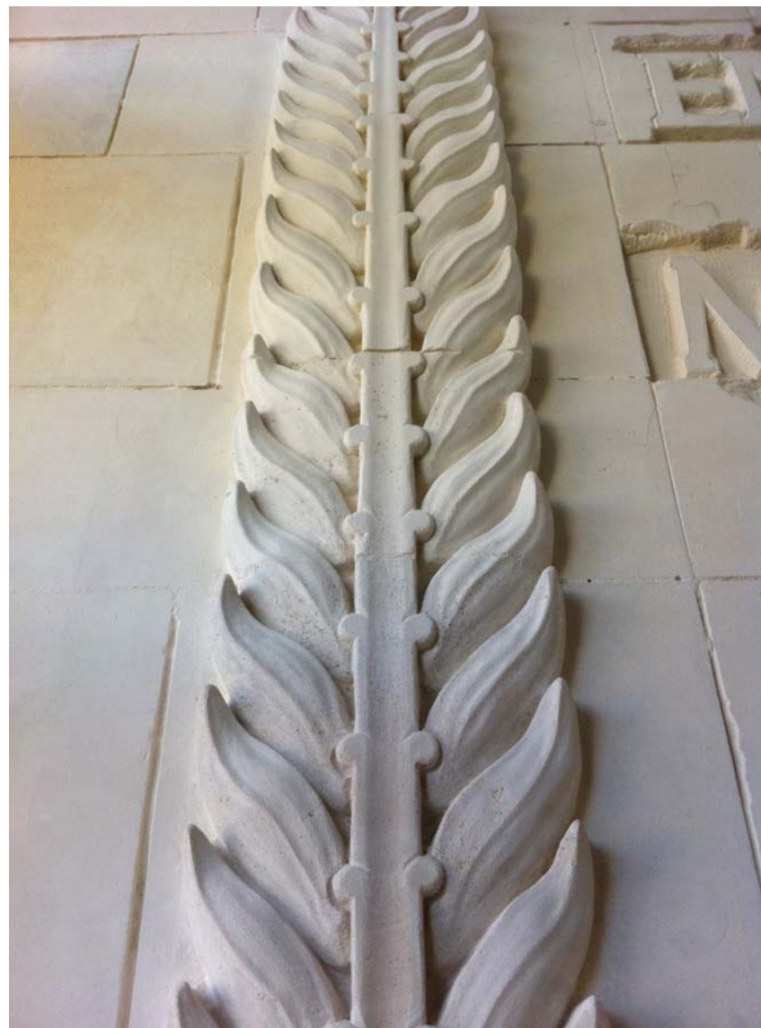
Monument première guerre mondiale. Masnière, France, 2014.