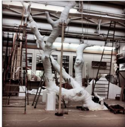
Opéra L'enlèvement au Sérail. Réalisation d'un arbre géant. Paris, 2014.