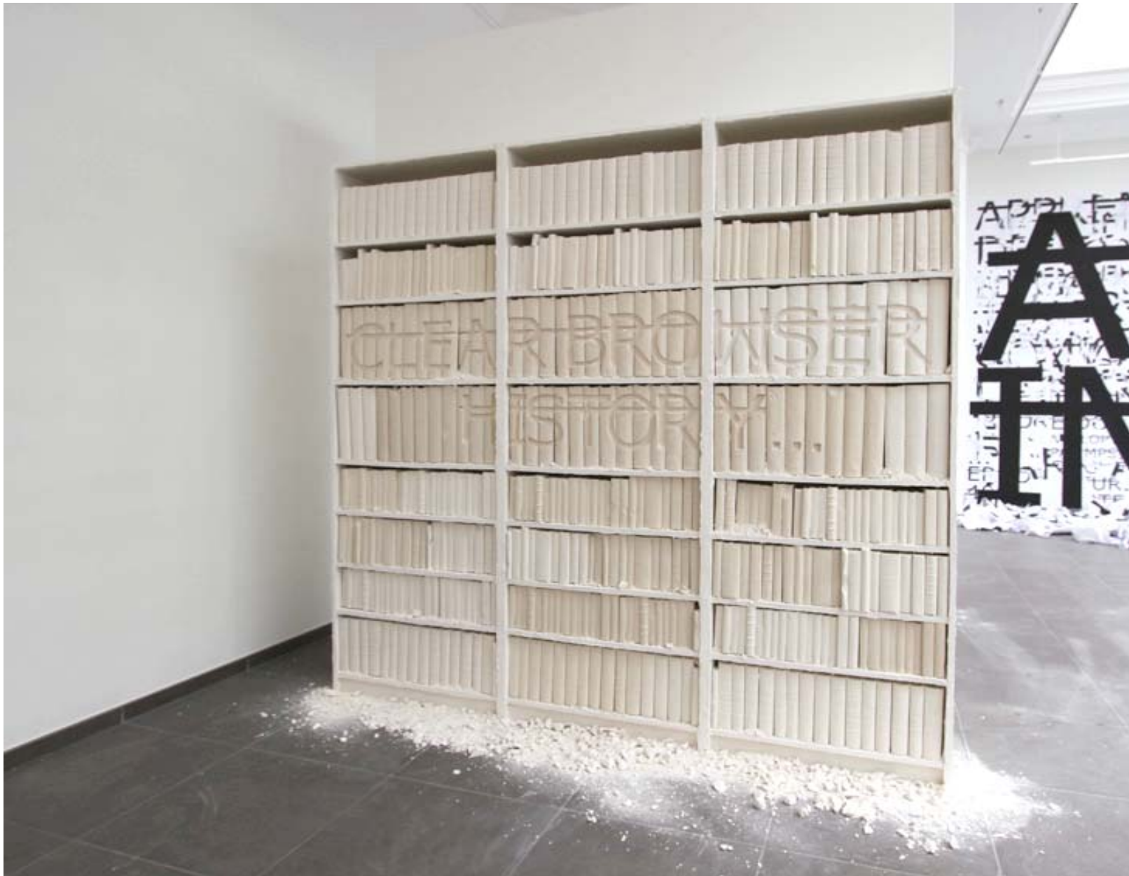
Réalisation d'une bibliothèque en plâtre, commande de RERO. Paris-Beijing Gallery, Brussels, 2014.