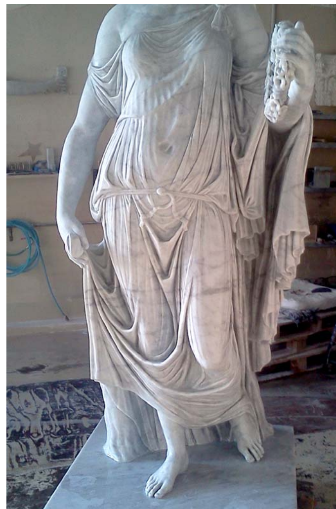
Reproduction de statues du Louvres et Versailles, marbre. Paris 2011-2012.