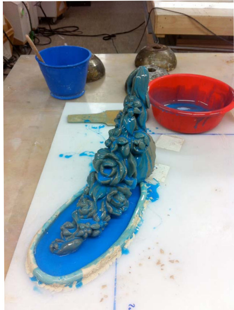
Opéra Traviata, modelage et moulage. Paris, 2013.