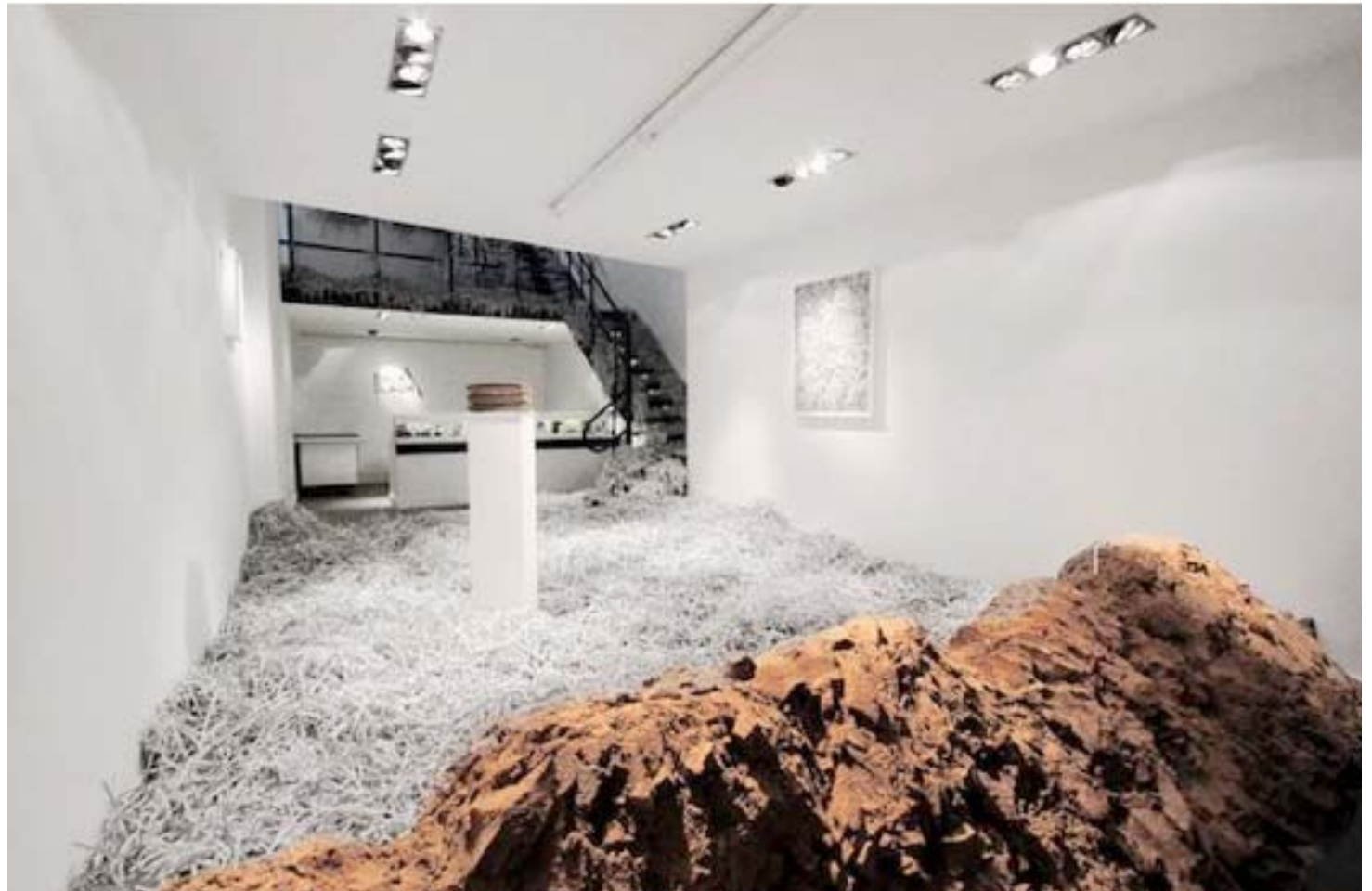
Sculpture d'un faux tas de terre en mousse, commande de RERO. Backslash Gallery, Paris, 2013.