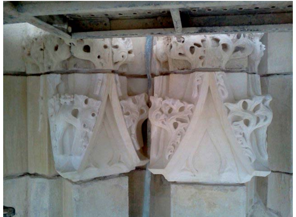
Sculpture ornaments 12e siècle. Cathédrale Saint-Cyr de Nevers. Nevers, France, 2013.