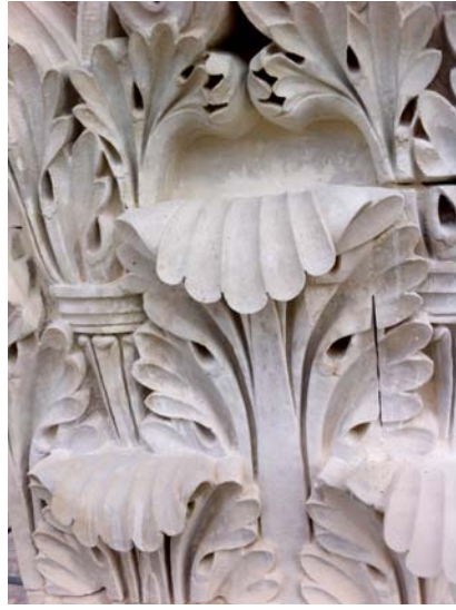
Assemblée nationale. Paris 2013.