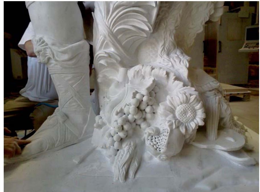
Sculpture de Louis XIV, marbre. Paris, 2012.