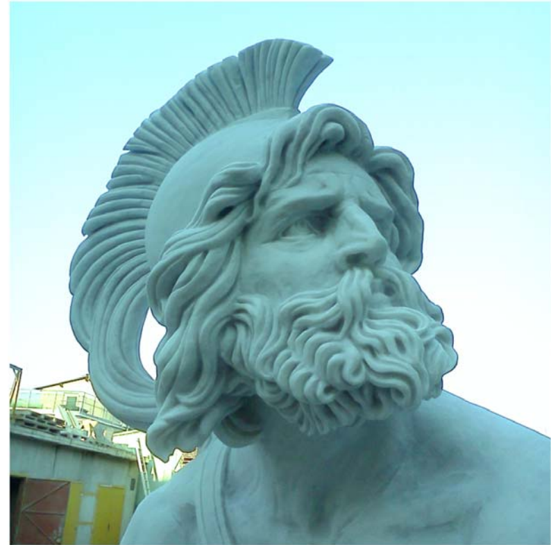
Reproduction de statues du Louvres et Versailles, marbre. Paris 2011-2012.