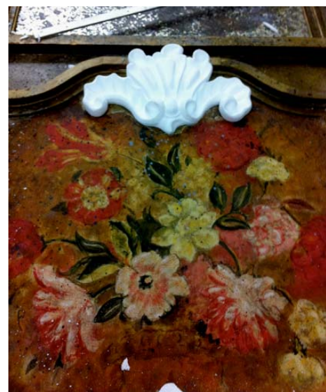
Opéra Casse-noisette, taille directe polystyrène, Paris, 2014.