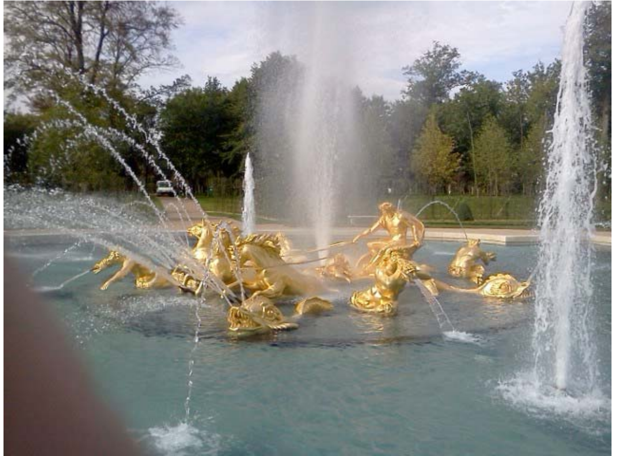
Reproduction du bassin d'Appolon de Versailles, pierre et feuille d'or. Paris, 2011.