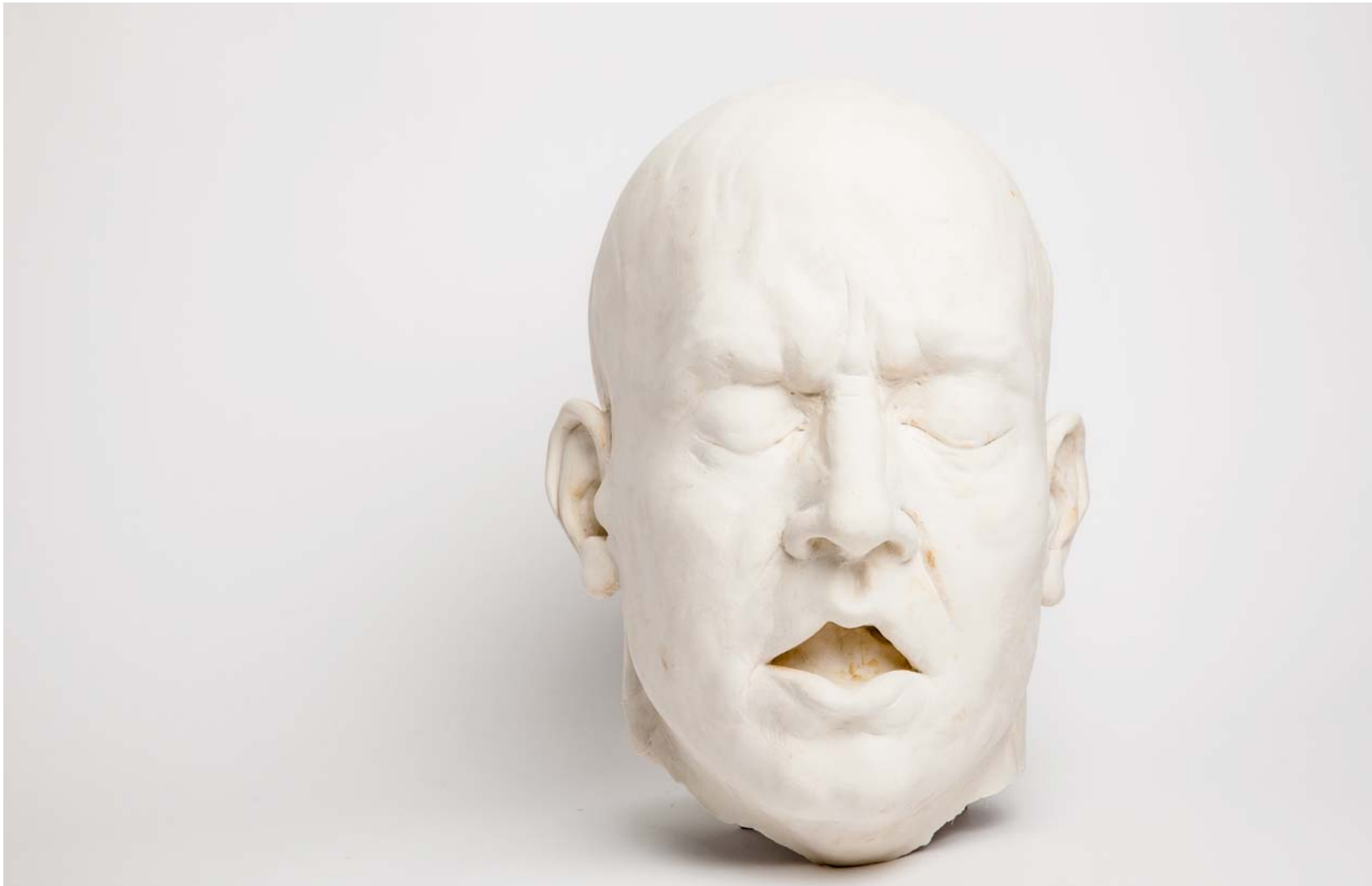
Portrait, sculpture et moulage (argile et plâtre). Paris, 2013-2014.